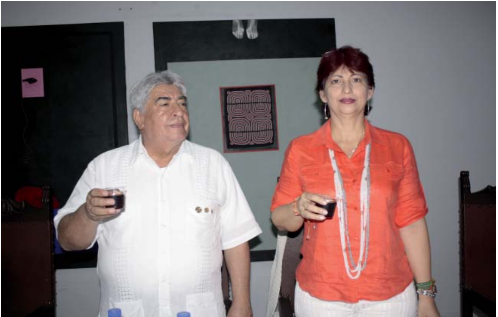
Con una copa de vino brindaron los asistentes a la Sesión Solemne de la Academia Huilense de Historia, realizada con motivo del primer Centenario de su fundación